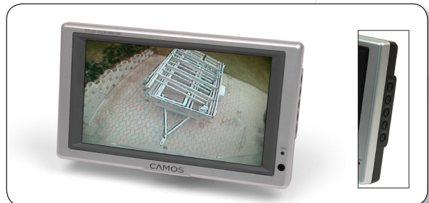
CM708, Camos 7" monitor som valgmulighed.